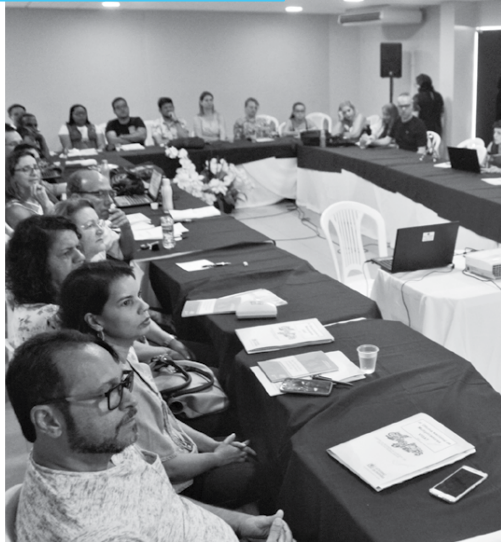
Agentes públicos de várias unidades do SUS participaram da oficina de multiplicadores de Visat em João Pessoa