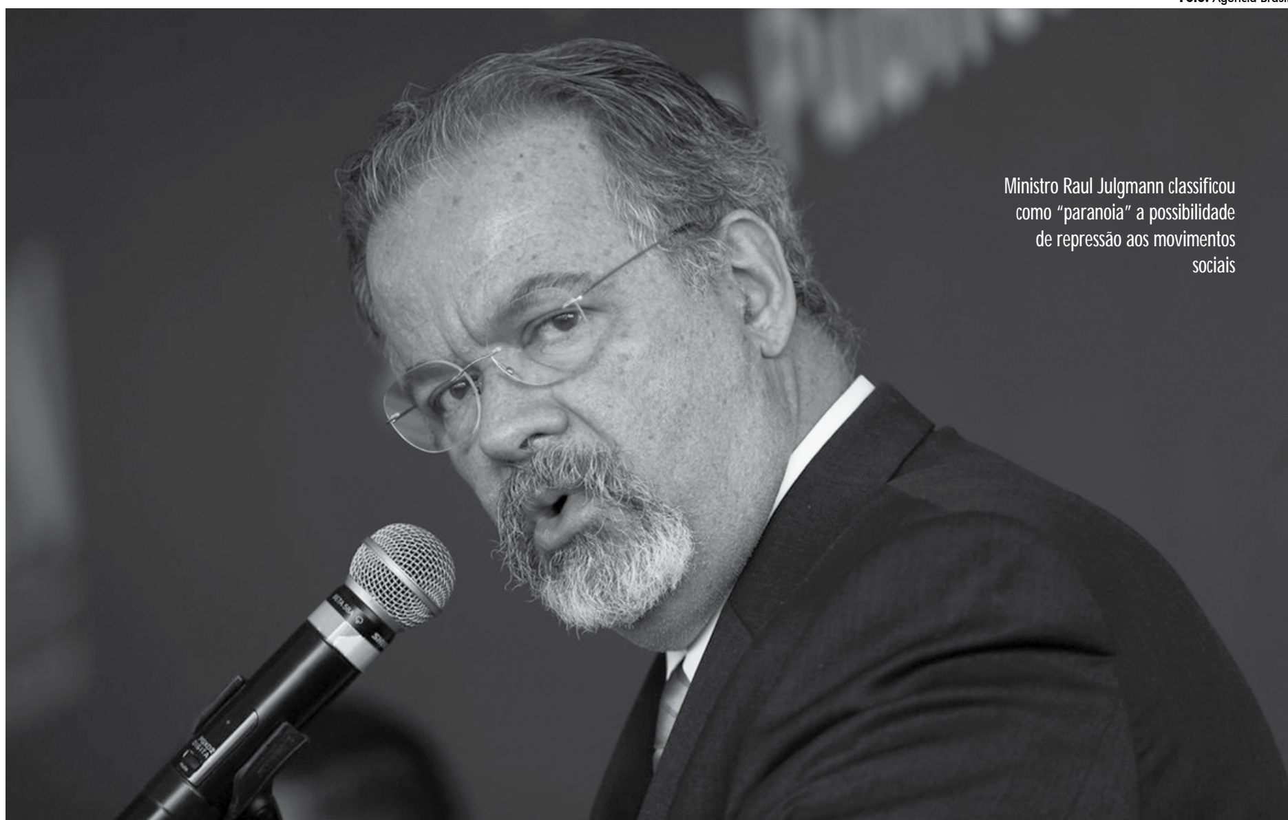
Ministro Raul Jungmann classificou como "paranoia" a possibilidade de repressão aos movimentos sociais

posteriormente à criação do grupo, a chamada "norma geral de ação" da força-tarefa, regulando o "desenvolvimento de ações e de rotinas de trabalho, em consonância com a Política Nacional de Inteligência, com a Estratégia