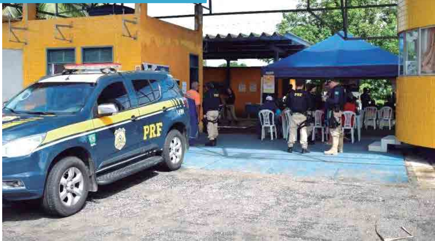
A campanha alusiva ao Dia Nacional de Combate ao Câncer Infantil é coordenada pela Comissão de Direitos Humanos da PRF e teve início em 2014