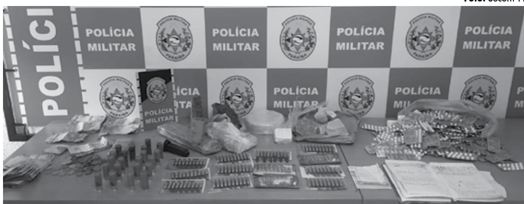
Em uma única ocorrência, foram apreendidas drogas e mais de 100 munições de diversos calibres na capital

Foram apreendidas 21 armas entre pistola, revólveres e espingardas, em mais de dez cidades: João Pessoa e Região Metropolitana, Campina Grande, Esperança, Dona Inês, Pedras de Fogo, Areia de Baraúnas, Cacimbas, Nova Floresta, Desterro, Queimadas e Alagoa Grande. Em uma única ocorrência, mais de 100 munições de diversos calibres foram apreendidas com um suspeito, em João Pessoa. Ele ainda estava com maconha, cocaína e comprimidos.