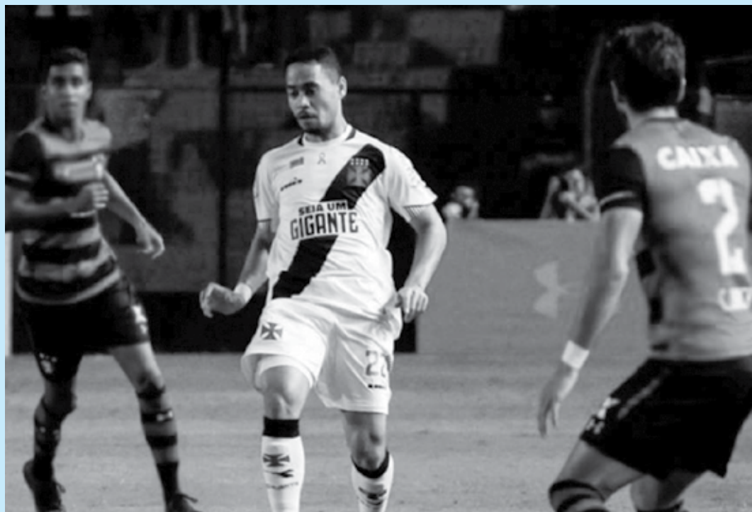
Pikachu se revoltou com os médicos do Vasco que pediram a sua substituição após concussão contra o Sport