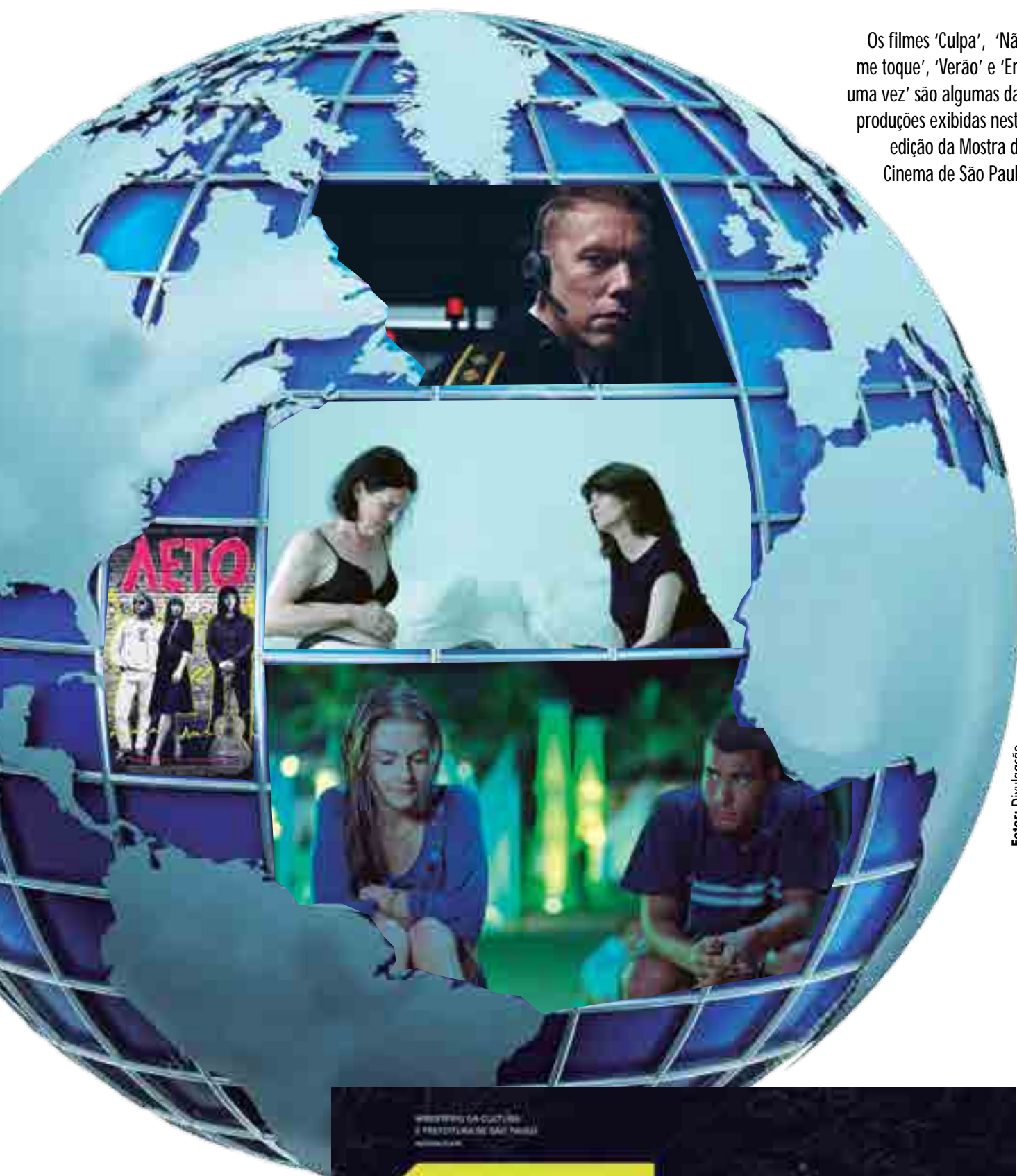
Os filmes 'Culpa', 'Não me toque', 'Verão' e 'Era uma vez' são algumas das produções exibidas nesta edição da Mostra de Cinema de São Paulo

Holiday, de Isabella Eklöf, é um exercício de humor negro com pintadas enganosas de "Sessão da Tarde". A história banal de Sancha, uma jovem que se envolve com um traficante dinamarquês numas férias paradisíacas no litoral da Turquia, vai sendo desconstruída quase por acaso no decorrer do filme. Com cenas fortes de sexo explícito e violência, a diretora vai tecendo um mundo de aparências e banalidades que irá desembocar no grotesco.