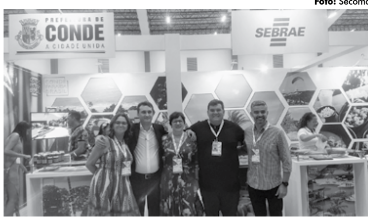
A prefeita destacou a participação no festival e parceria com a PBTur

“Além do festival, nós também estamos tendo a oportunidade de receber agentes de viagem e operadores de Turismo em nossa cidade” destacou.